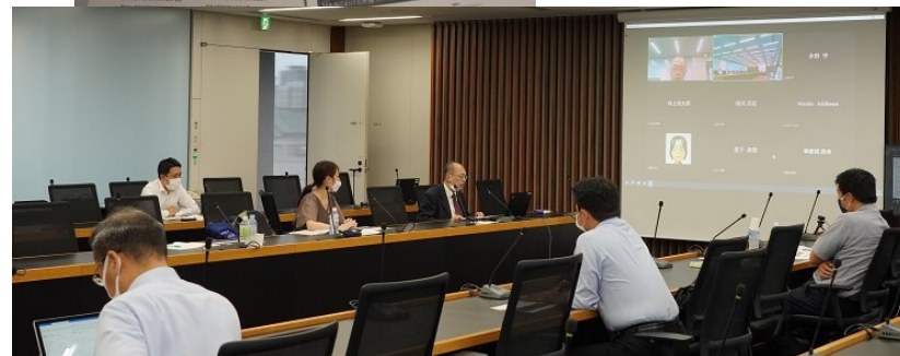
フリーディスカッションを行うセンターと大阪弁護士会の参加者