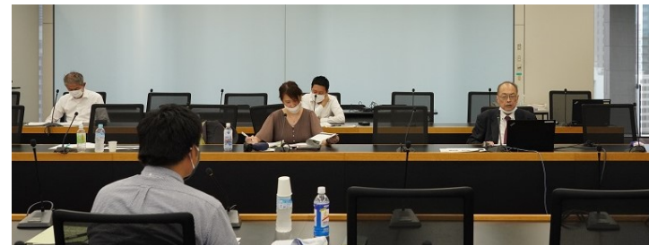
弁護士との連携事例を報告する上宮PM