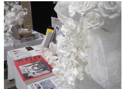
A41 枚の繊維のゴミからつくった 紙で作る薔薇キット

協同組合関西ファッション連合によるパネル展示を実施。SDGs に関して積極的に取り組みを進める企業・学校を紹介するパネル 27 枚を展示した。