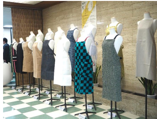
素材を活用した傘の展示