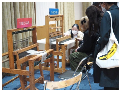
手織り体験コーナー (株)林与ブース内)