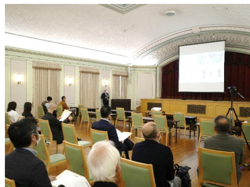
各社プレゼンテーション