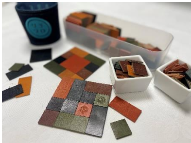
簡単に作れるオリジナル本革コースター