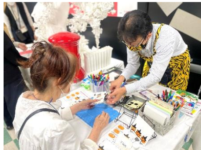
繊維ゴミを再利用したハガキを デコレーションしてポスト投函キット