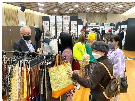
産地による素材展示・商談

(株)ウインビー / (株)ウエマツ / (株)大江 / 大城戸織布 / 大津毛織(株) / かこっとな(株) / 笹田織物(株) / (株)三昌 / 妙中パイル織物(株) / たてつなぎ / (一社)Textile Circular Network / (株)日本ハイパイル / (株)林与 / (株)福井プレス / (株)二口製紐 / 増見哲(株) / 吉田染工(株)