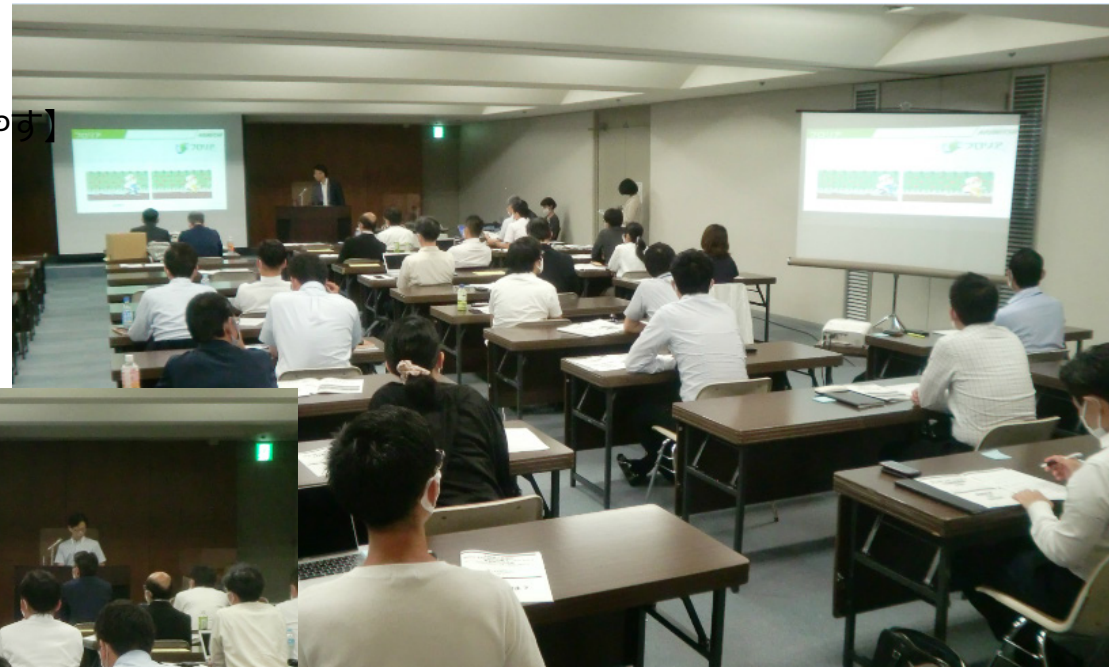
SDGs・ESGビジネスプラン発表・交流会の様子。会場では十分なスペースを作り、コロナ禍に配慮した。

→オンラインを含め178人が参加。延べ99件の感想や意見、協業の申し出等が参加者から寄せられ、発表企業にフィードバック。発表企業から回答があった場合は、再度、そのメッセージを参加者に伝え、事業のきっかけ作りを手伝った。